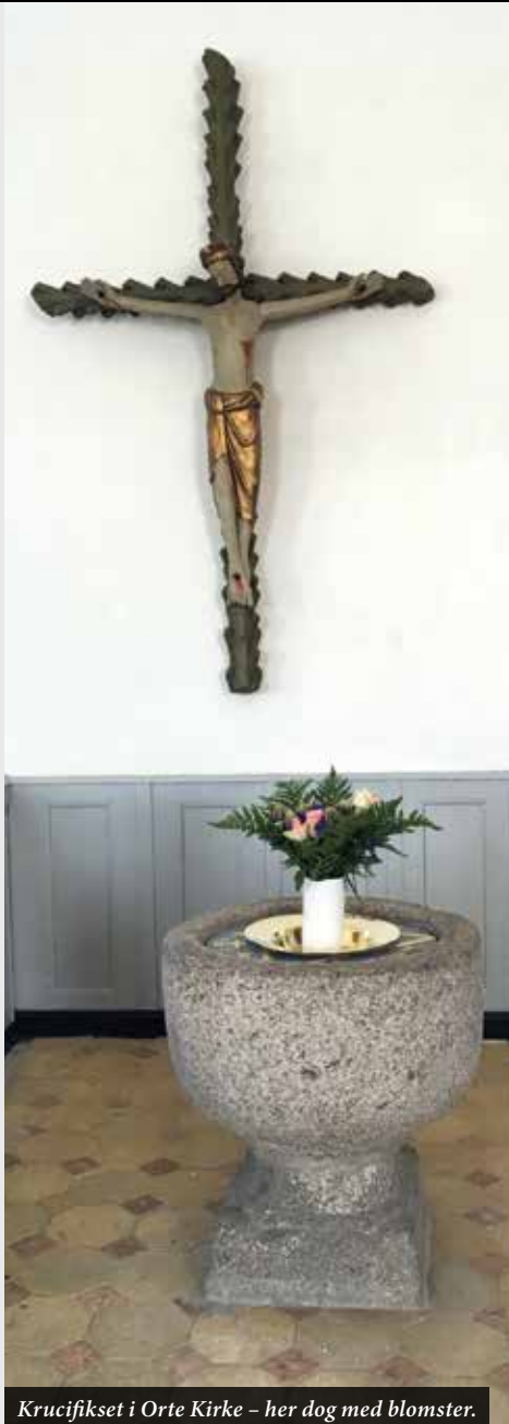
Krucifikset i Orte Kirke – her dog med blomster.

Sådan skal det være, og det kan få god mening og betydning for ens eget liv at gå i kirke langfredag og mærke tyngden – og dét lys, der skal komme ud af langfredags mørke.