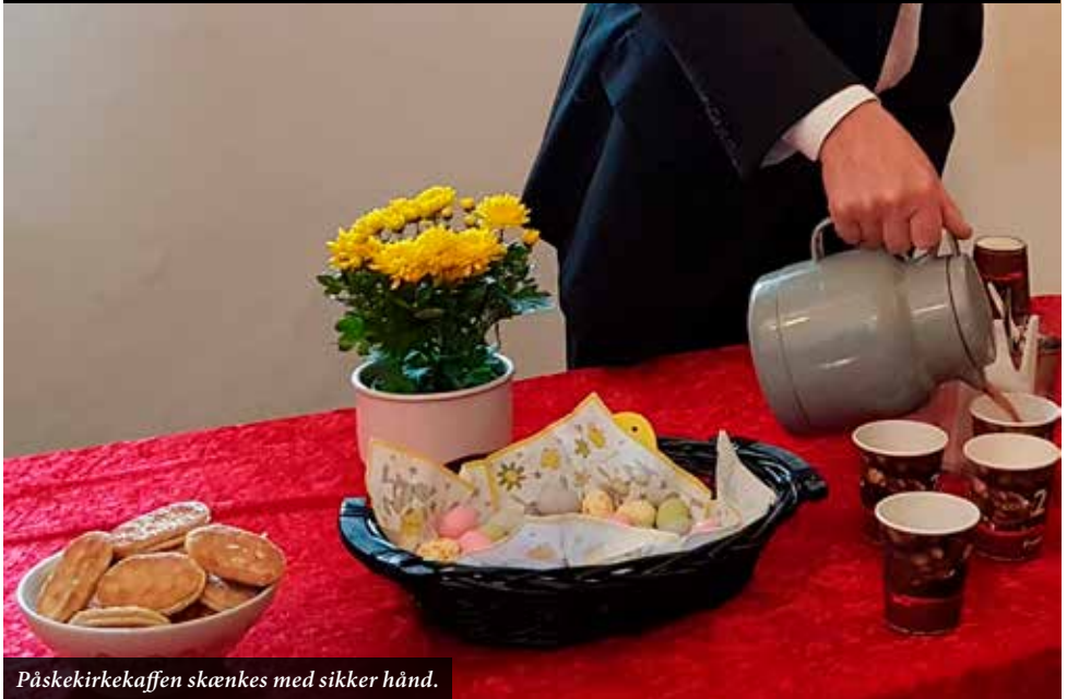
Påskelirkekaffen skænkes med sikker hånd.