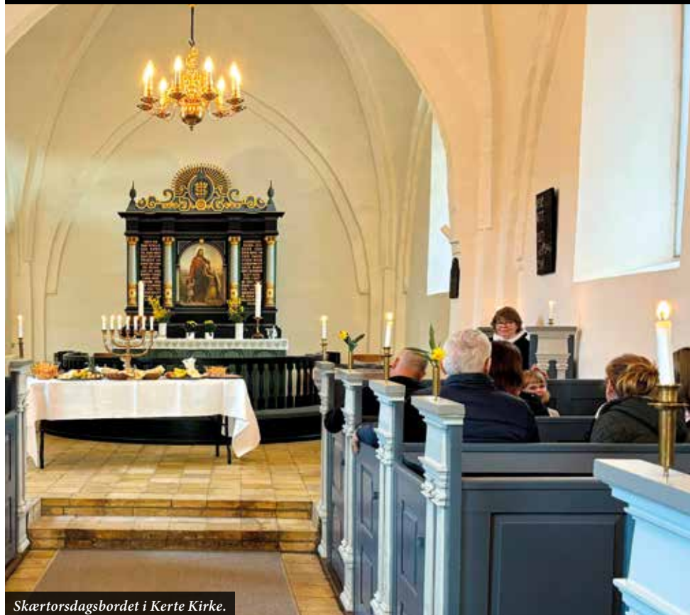
Skærtorsdagsbordet i Kerte Kirke.

Skærtorsdag d. 17. april kl. 17:00: Gudstjeneste med måltid i Kerte Kirke.