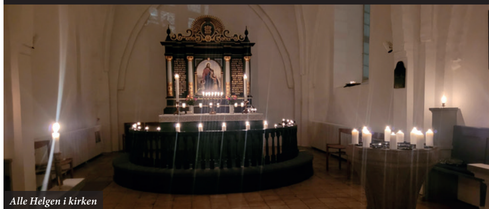
Alle Helgen i kirken

Vi mindes vore døde og tænder lys søndag d. 3. november.