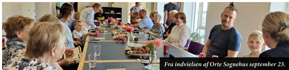
Fra indvielsen af Orte Sognehus september 23.