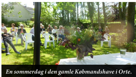
En sommerdag i den gamle Købmandshave i Orte.

Søndag d. 9. juni kl. 11.00 i den gamle Købmandshave bag Orte Sognehus.