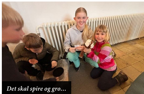
Det skal spire og gro...

Fredag den 12. april afholdt vi igen pandekagegudstjeneste i Kerte Kirke.