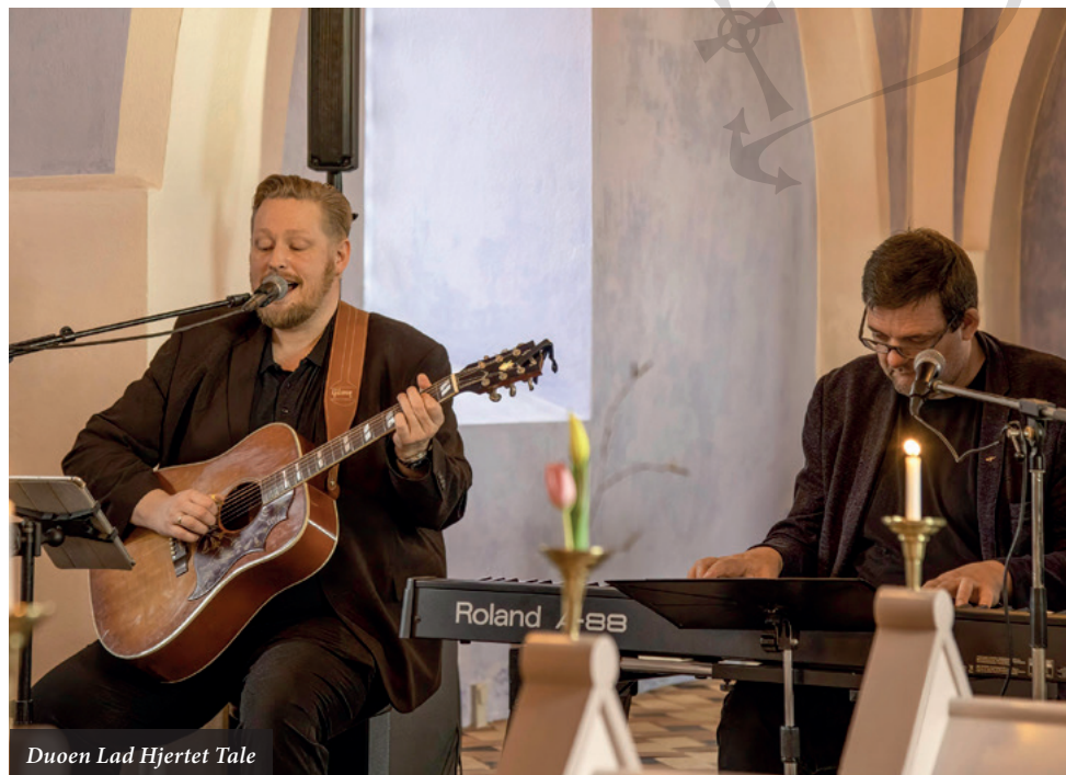
Duoen Lad Hjertet Tale

Der er gratis entré, men støt altid gerne vores faste indsamling til Kirkens Korshærs Varmestue! Alle er hjerteligt velkomne.