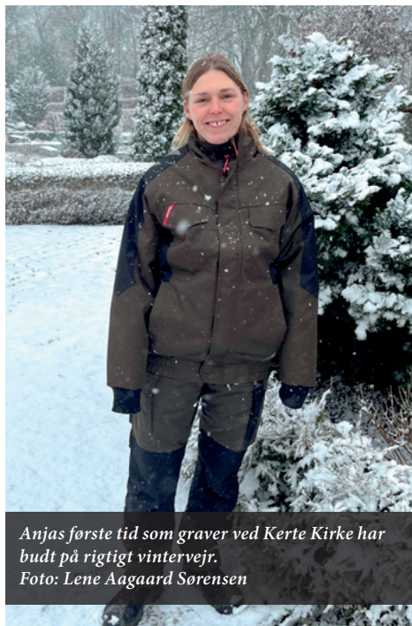
Anjas første tid som graver ved Kerte Kirke har budt på rigtigt vintervejr.