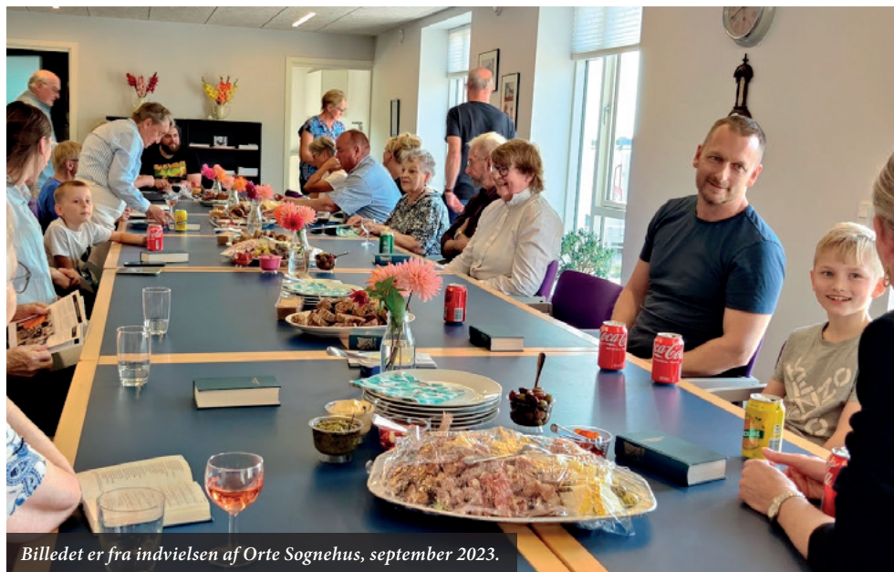
Billedet er fra indvielsen af Orte Sognehus, september 2023.

Så tag gerne din nabo under armen, og kom og mød andre til nogle hyggelige timer med samvær og nem aftensmad.