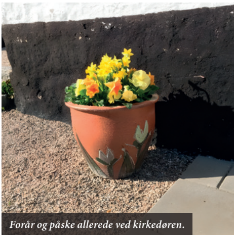
Forår og påske allerede ved kirkedøren.

Efter gudstjenesten er der som altid kirkekaffe, og der er tradition for påskeæg til kaffen, når det er påskedag.