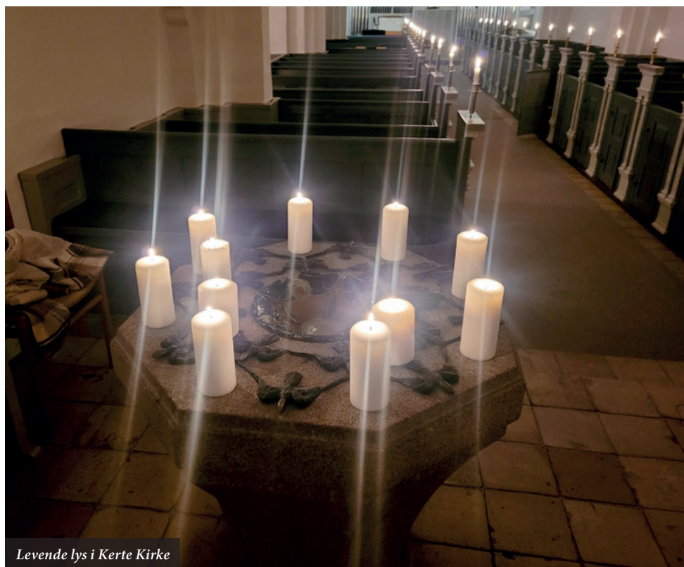
Levende lys i Kerte Kirke